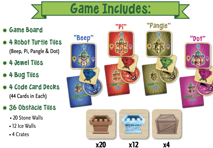
FIGURE 2 – Contenu du jeu complet.

La Figure 2 illustre l'ensemble du contenu du coffret de jeu. Dans le cadre de ce projet, nous n'allons pas forcément utiliser tout ce qui est décrit en Figure 2.